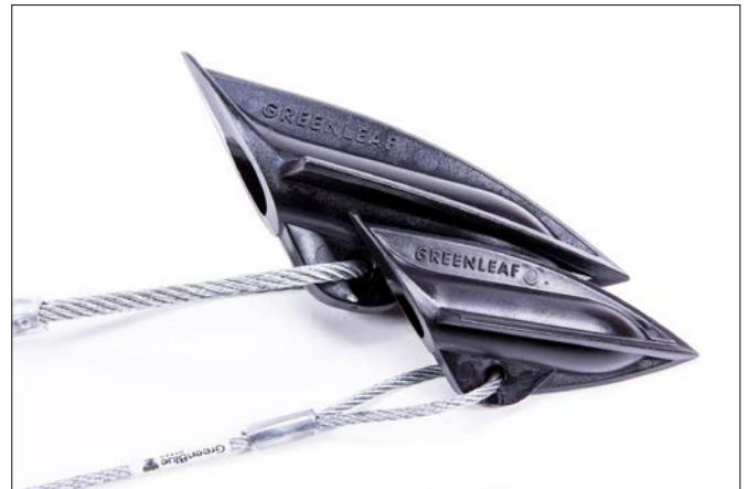
tot 20 of tot 45 cm composiet anker