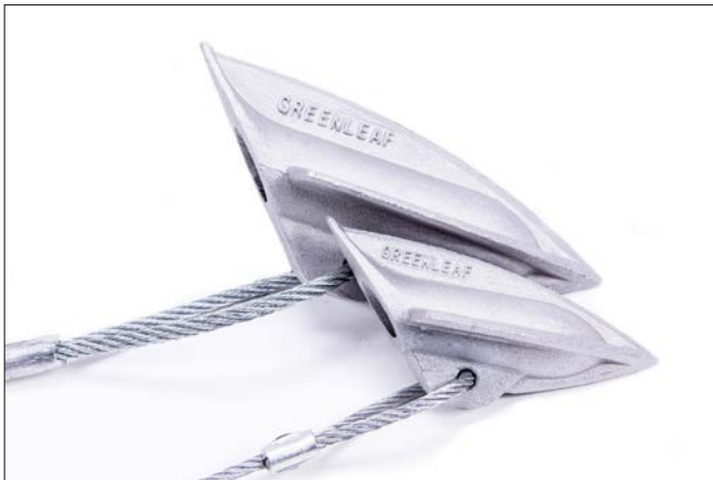
tot 20 of tot 45 cm aluminium anker